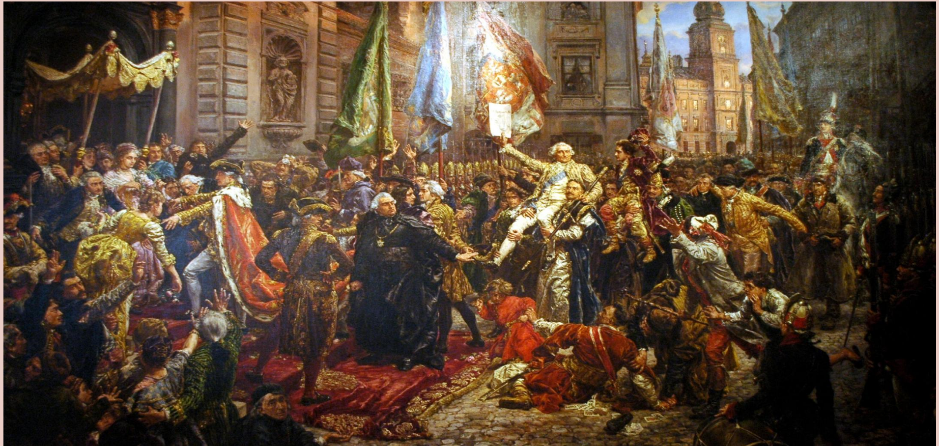
Obraz Jana Matejki „Konstytucja 3 Maja 1791 r.”